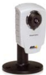
Cámara IP AXIS 207/207W/207MW con soporte – soporte incluido