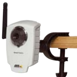
Cámara IP AXIS 207/207W/207MW con pinza flexible – pinza incluida